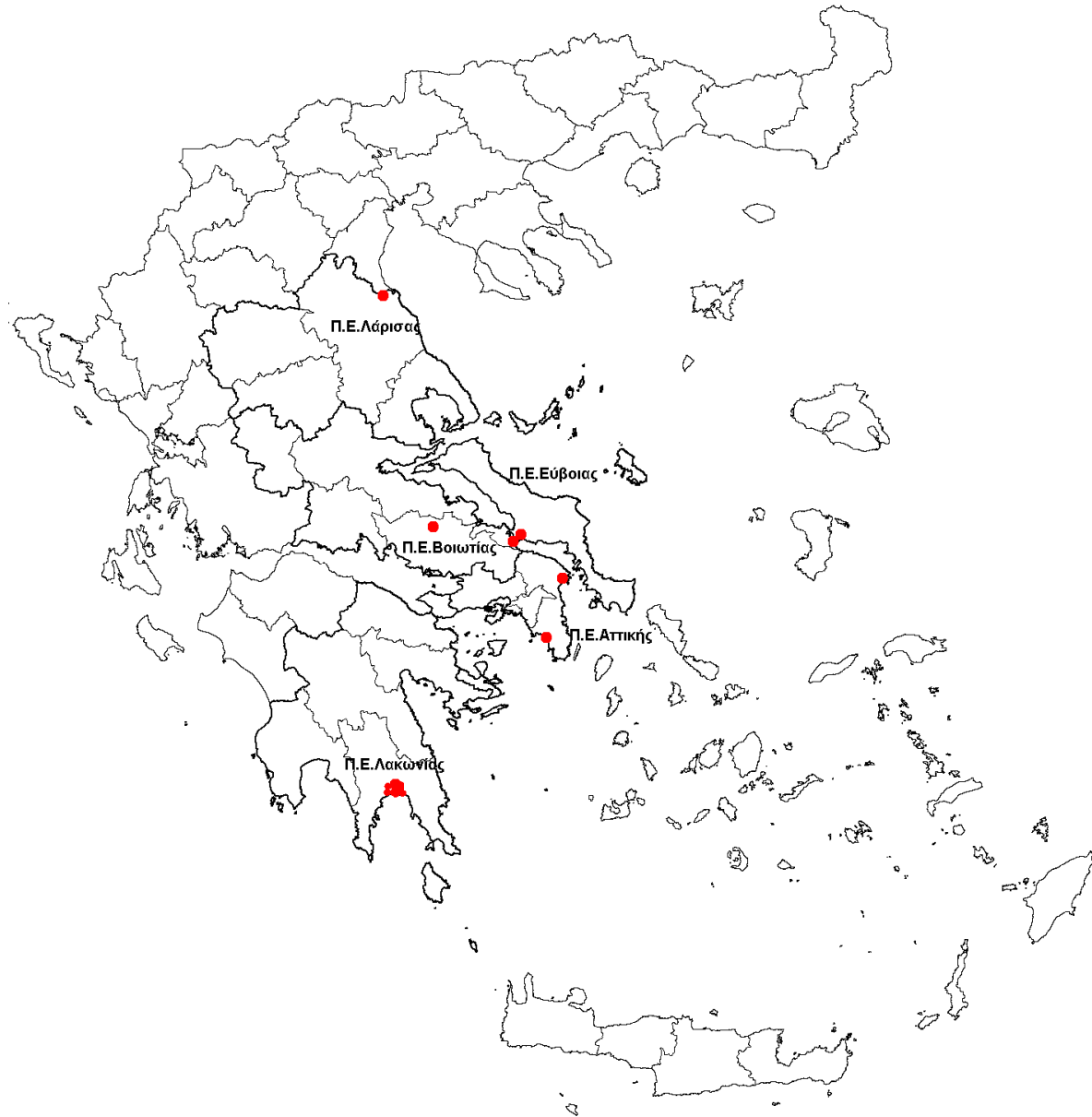
Εικόνα 1. Τόπος κατοικίας ασθενών με ελονοσία χωρίς ιστορικό ταξιδιού σε ενδημική χώρα. Ελλάδα, περίοδος 2011 (έως 31.12.2011).

Οι ηλικίες των Ελλήνων ασθενών χωρίς αναφερόμενο ιστορικό ταξιδιού σε ενδημικές περιοχές, κυμαίνονται από 19 μήνες – 79 έτη (διάμεση ηλικία: 45 έτη). Το 57,6 % ήταν άνδρες.