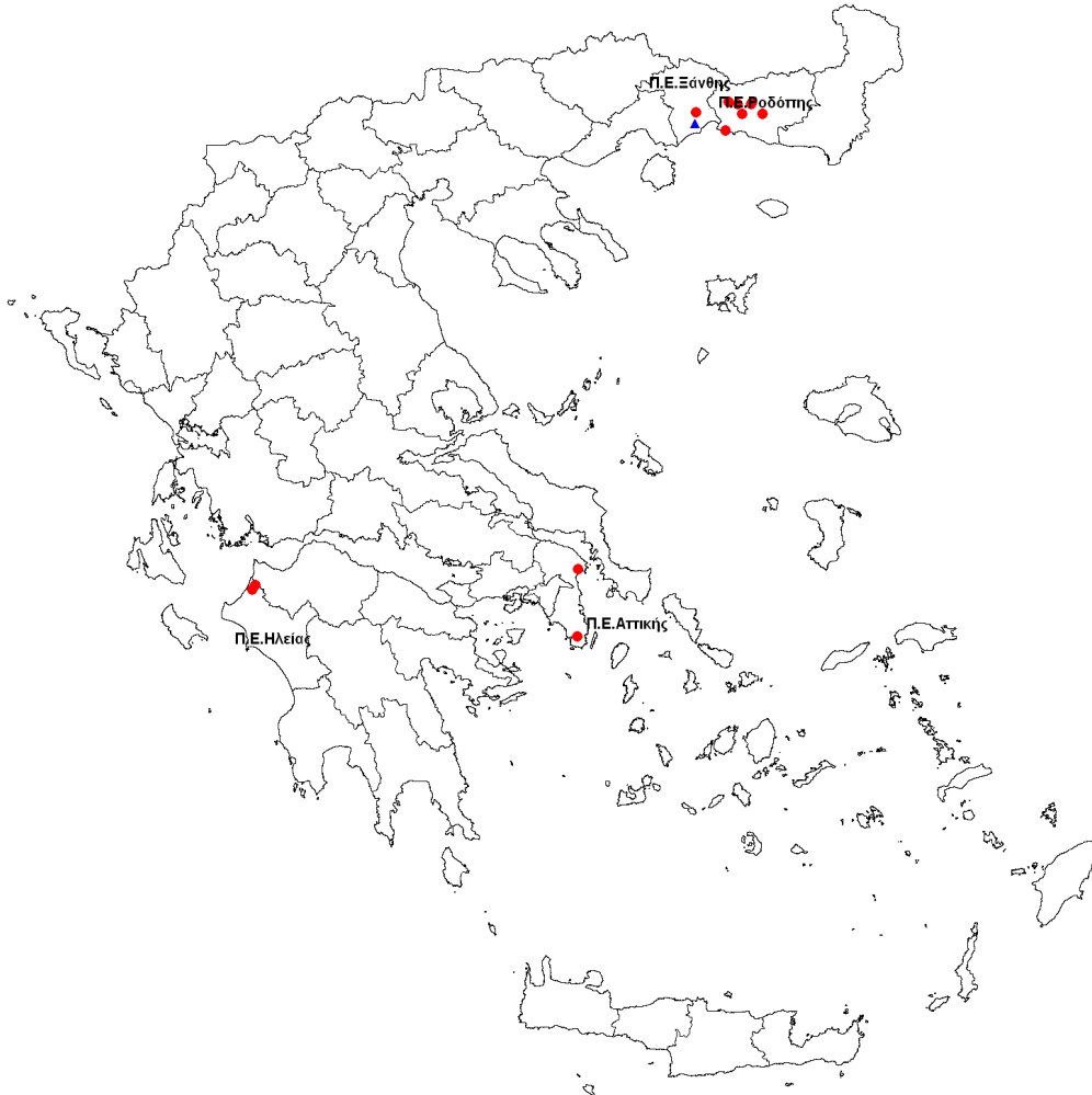
Εικόνα 2: Χάρτης με αποτύπωση του εκτιμώμενου τόπου έκθεσης των δηλωθέντων κρουσμάτων λοίμωξης από τον ιό του Δυτικού Νείλου, Ελλάδα, 2014, έως 03/10/2014, ώρα 13.00 (n=15).*