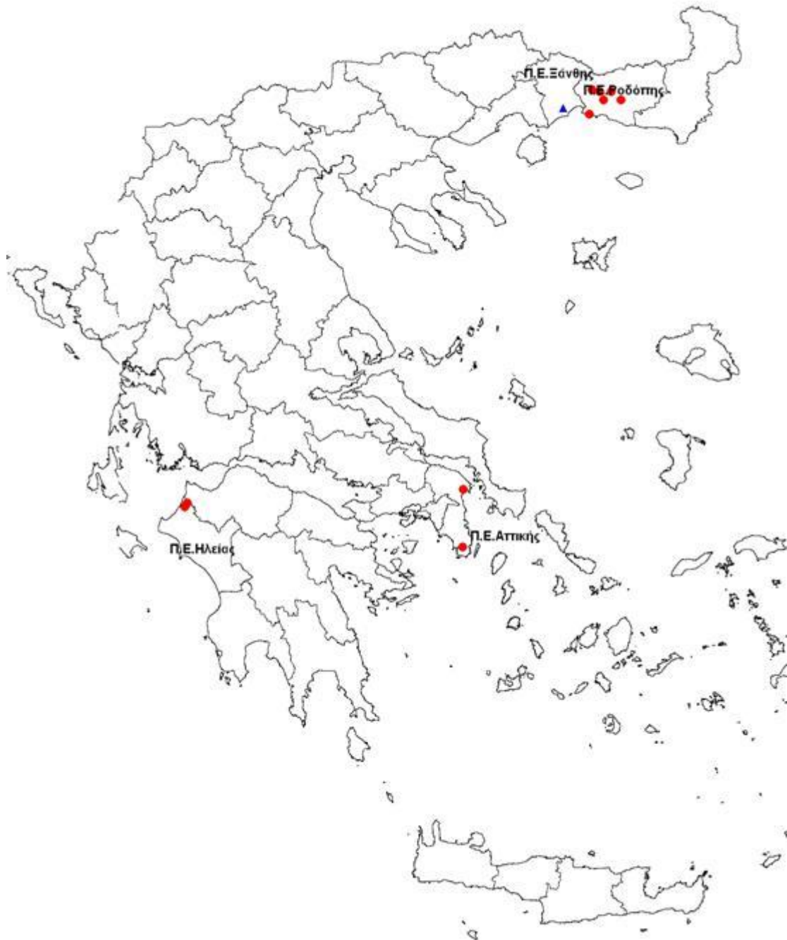
Εικόνα 2: Χάρτης με αποτύπωση του εκτιμώμενου τόπου έκθεσης των δηλωθέντων κρουσμάτων λοίμωξης από τον ιό του Δυτικού Νείλου, Ελλάδα, 2014, έως 11/09/2014, ώρα 13.00 (n=13).*