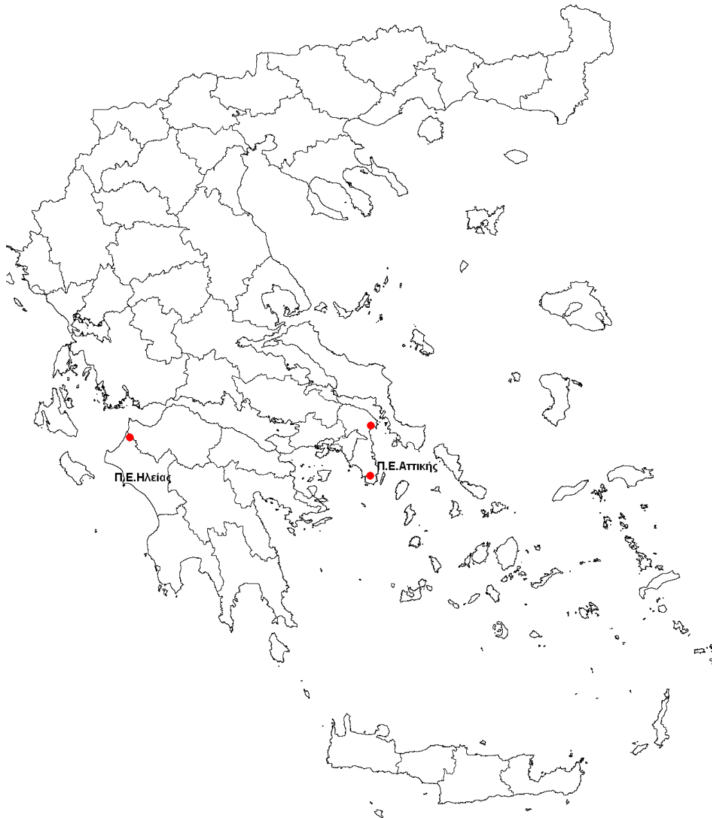
Εικόνα 2: Χάρτης με αποτύπωση του εκτιμώμενου τόπου έκθεσης των δηλωθέντων κρουσμάτων λοίμωξης από τον ιό του Δυτικού Νείλου, Ελλάδα, 2014, έως 21.08.2014, ώρα 11.00 π.μ. (n=3).*