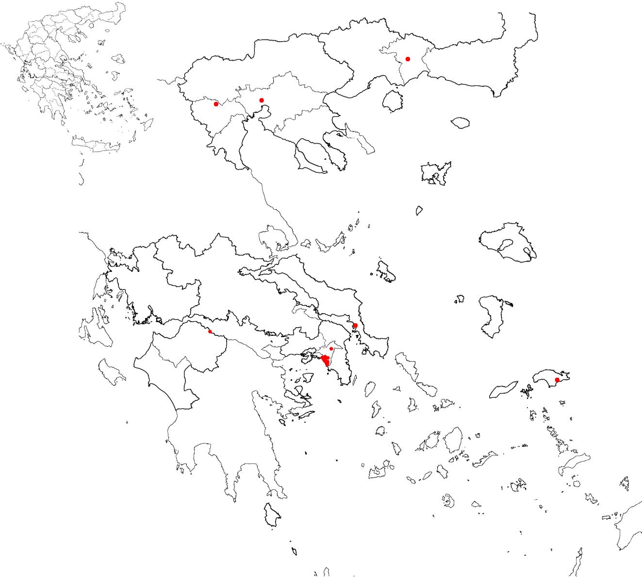
Εικόνα 2: Χάρτης με αποτύπωση του πιθανού τόπου έκθεσης των ασθενών με εργαστηριακή διάγνωση λοίμωξης από ιό του Δυτικού Νείλου με εκδηλώσεις από το κεντρικό νευρικό σύστημα (n=32). Περίοδος 2012, έως 09.08.2012 (ώρα 16.00).