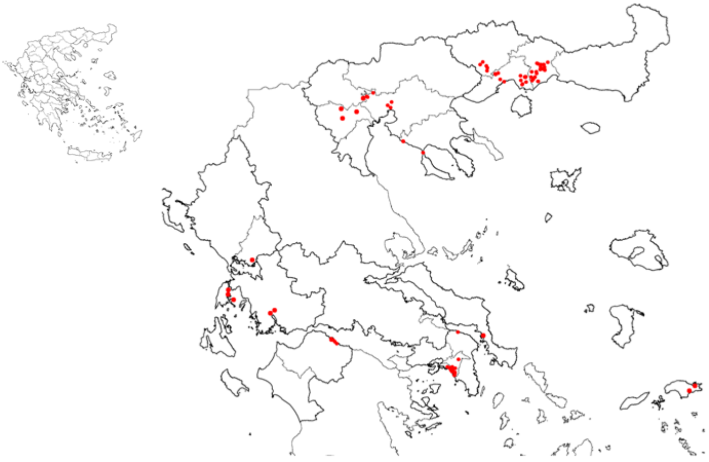
Εικόνα 2: Χάρτης με αποτύπωση του πιθανού τόπου έκθεσης των ασθενών με εργαστηριακή διάγνωση λοίμωξης από ιό του Δυτικού Νείλου με εκδηλώσεις από το κεντρικό νευρικό σύστημα (n=102). Περίοδος 2012, έως 5.10.2012 (ώρα 16.00).