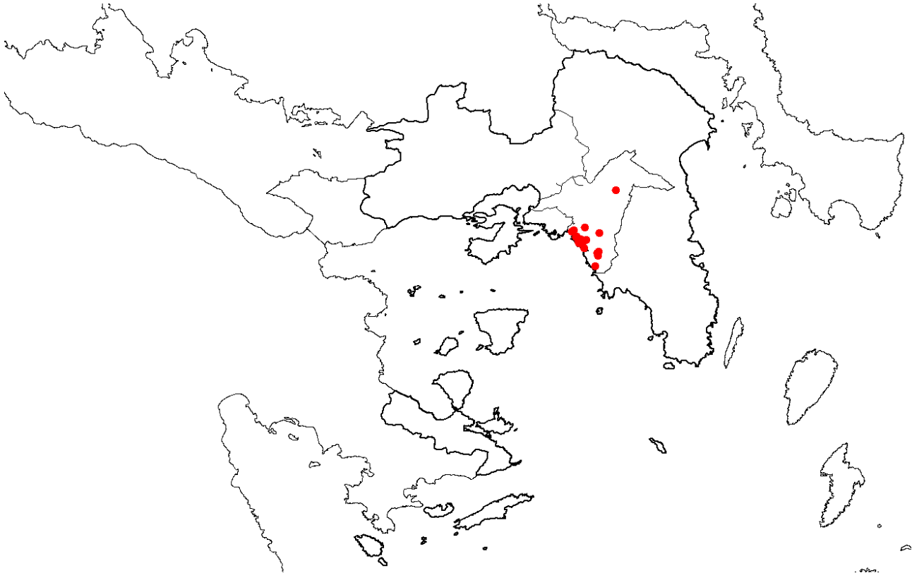
Εικόνα 3: Χάρτης με αποτύπωση του τόπου κατοικίας των ασθενών με εργαστηριακή διάγνωση λοίμωξης από τον ιό του Δυτικού Νείλου με εκδηλώσεις από το κεντρικό νευρικό σύστημα (n=23) στην περιοχή της Αττικής. Περίοδος 2012 έως 02.08.2012 (ώρα 16.00)