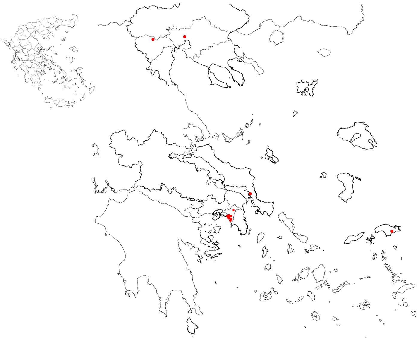
Εικόνα 2: Χάρτης με αποτύπωση του πιθανού τόπου έκθεσης των ασθενών με εργαστηριακή διάγνωση λοίμωξης από ιό του Δυτικού Νείλου με εκδηλώσεις από το κεντρικό νευρικό σύστημα (n=27). Περίοδος 2012, έως 02.08.2012 (ώρα 16.00).