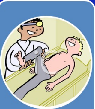
Ιατρονοσηλευτική φροντίδα (που απαιτεί επαφή με τον ασθενή μέσα στη ζώνη του ασθενή)