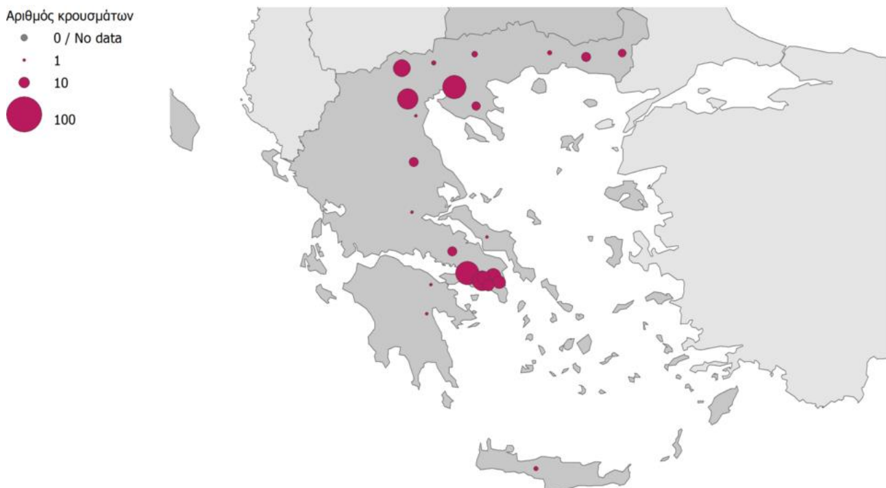
Εικόνα 2: Διαβάθμιση αριθμού κρουσμάτων λοίμωξης από τον ιό του Δυτικού Νείλου (ΙΔΝ) ανά πιθανή Περιφερειακή Ενότητα έκθεσης, Ελλάδα, 2018 (n=313).

Map produced on: 18 Feb 2019. Administrative boundaries: ©EuroGeographics, ©UN-FAO