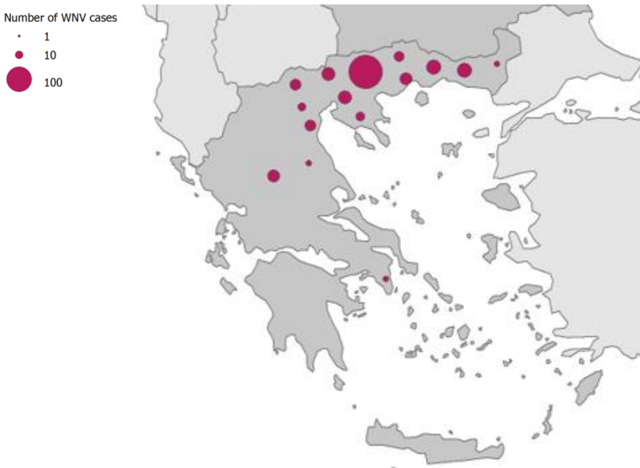
Εικόνα 2: Διαβάθμιση αριθμού κρουσμάτων λοίμωξης από τον ιό του Δυτικού Νείλου ανά πιθανή Περιφερειακή Ενότητα έκθεσης, Ελλάδα, 2020 (n=143 [1] ).

Map produced on: 2 Apr 2021. Administrative boundaries: ©EuroGeographics, ©UN-FAO