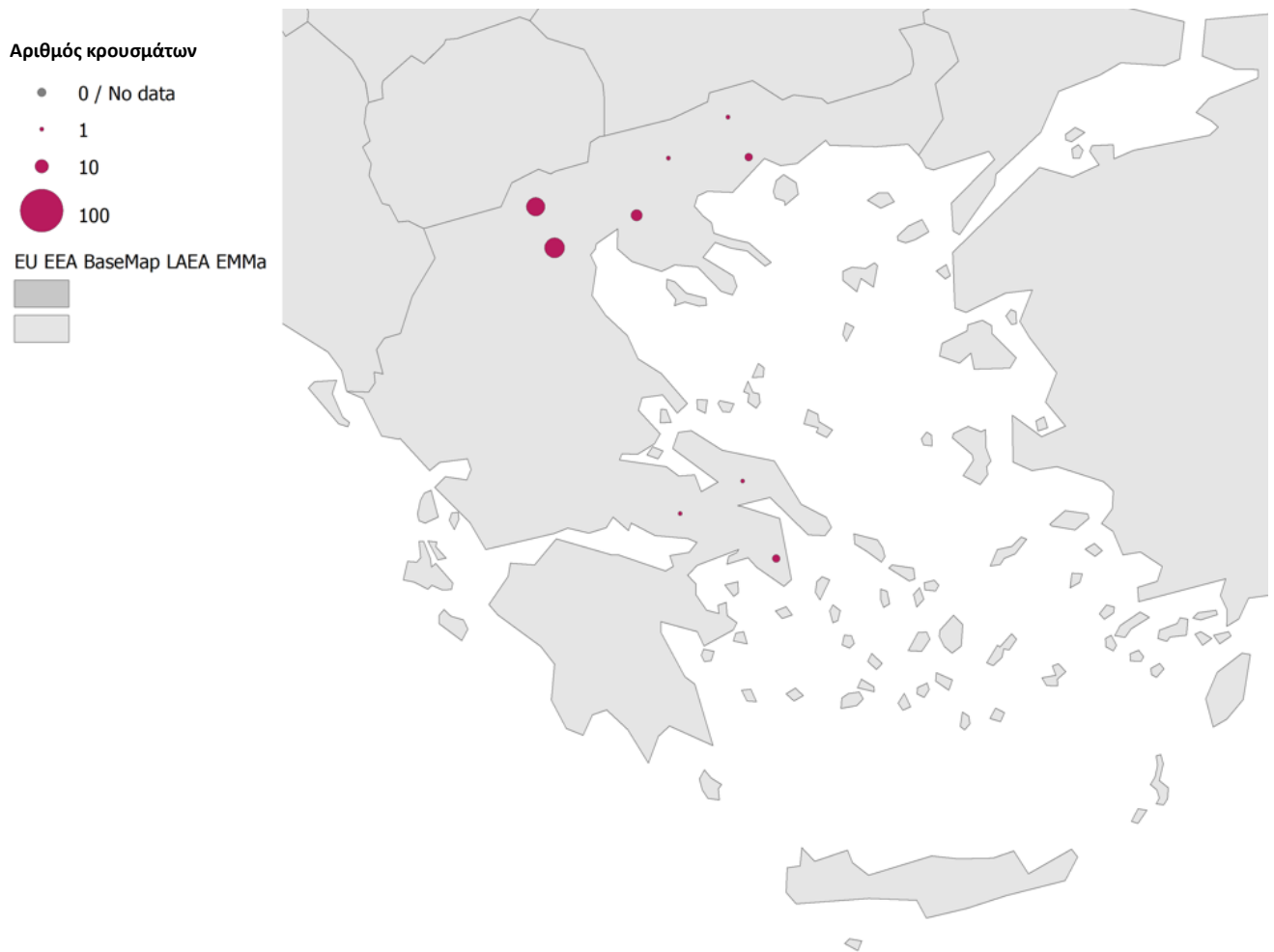
Εικόνα 2: Διαβάθμιση αριθμού κρουσμάτων λοίμωξης από τον ιό του Δυτικού Νείλου ανά εκτιμώμενη Περιφερειακή Ενότητα έκθεσης, Ελλάδα, 2021 (n=58 [1] ).

Administrative boundaries: © EuroGeographics © UN-FAO © Turkstat. The boundaries and names shown on this map do not imply official endorsement or acceptance by the European Union. Map produced on: 11 Feb 2022