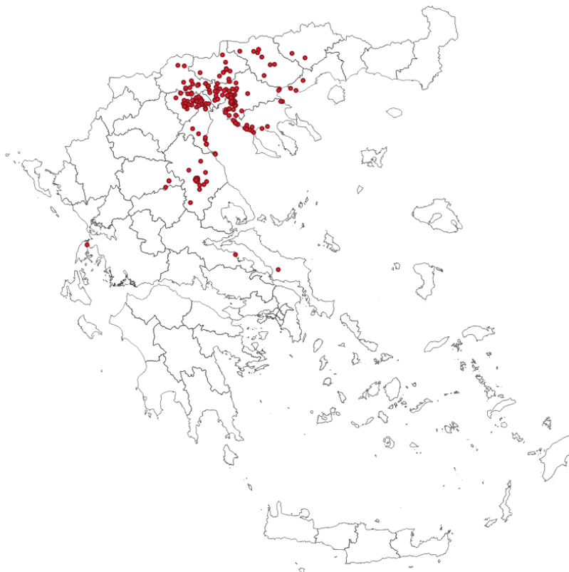
Εικόνα 2: Γεωγραφική κατανομή κρουσμάτων λοίμωξης από τον ιό του Δυτικού Νείλου, Ελλάδα, 2022 [1]