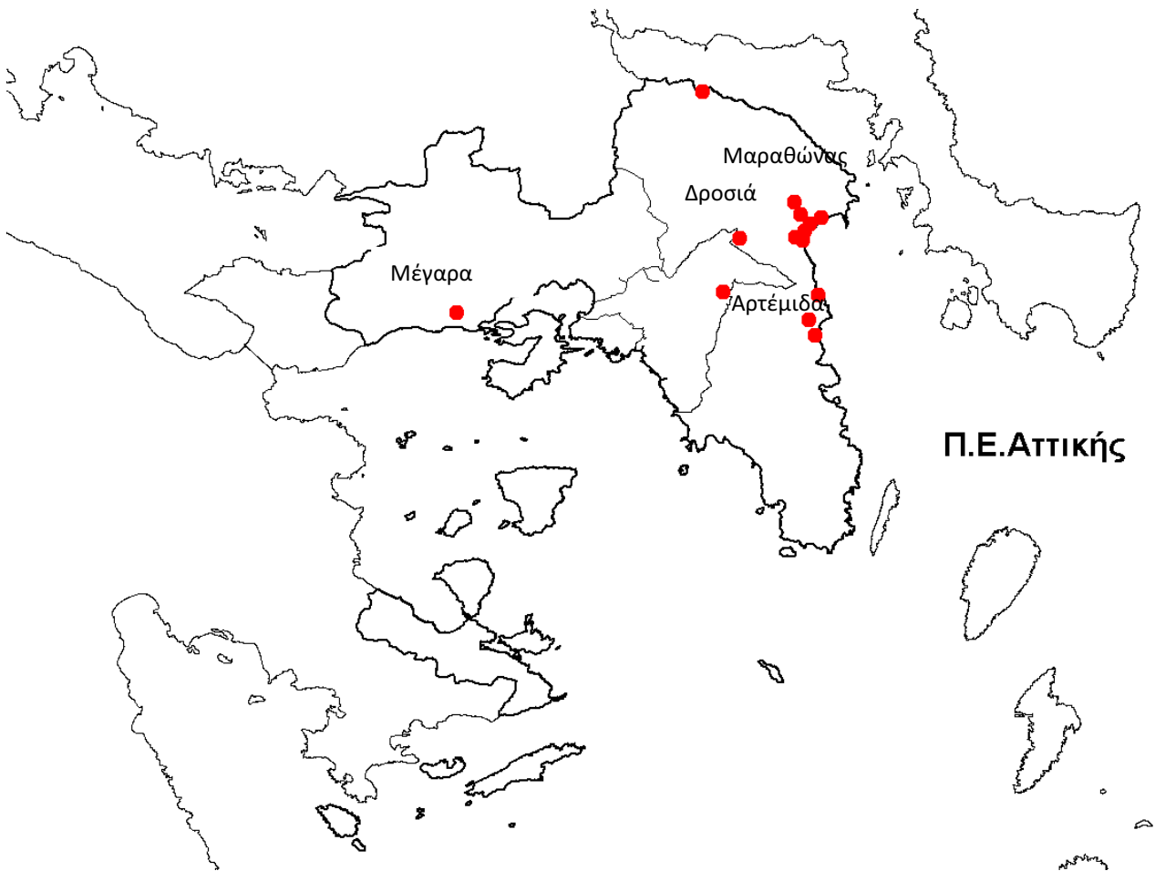
Εικόνα 3: Χάρτης με αποτύπωση του τόπου κατοικίας των ασθενών με εργαστηριακή διάγνωση λοίμωξης από τον ιό του Δυτικού Νείλου με εκδηλώσεις από το κεντρικό νευρικό σύστημα στην περιοχή της Αττικής. Περίοδος 2011 έως 14.09.2011 (ώρα 16.00)