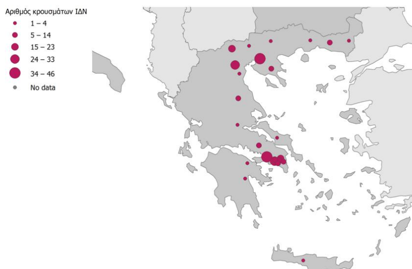
Εικόνα 2: Διαβάθμιση αριθμού κρουσμάτων λοίμωξης από τον ιό του Δυτικού Νείλου (ΙΔΝ) ανά πιθανή Περιφερειακή Ενότητα έκθεσης, Ελλάδα, 2018 (n=306)*.

1. Υπολογίστηκε με βάση στοιχεία πληθυσμού της ΕΛ.ΣΤΑΤ. (απογραφή 2011)