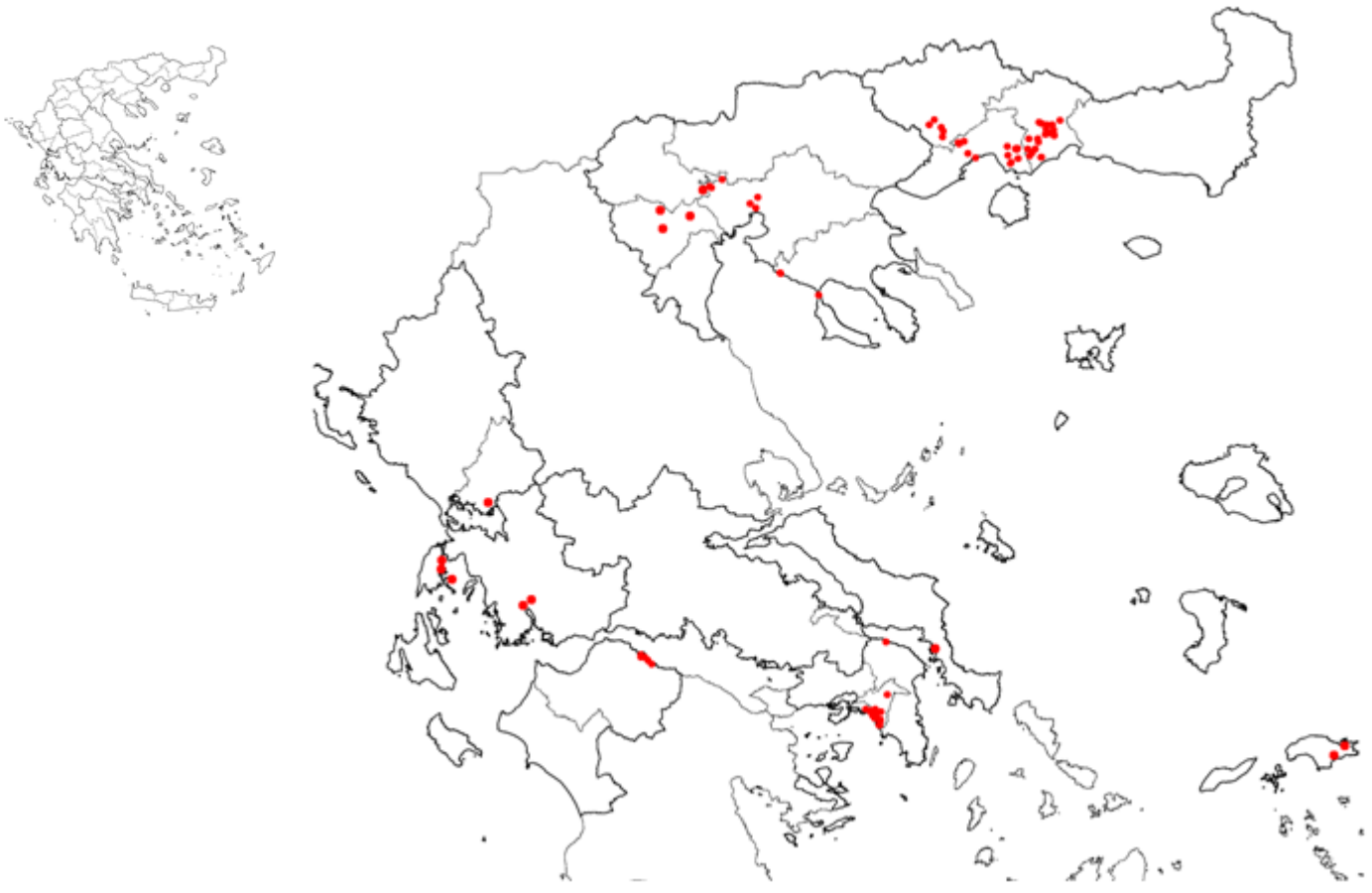
Εικόνα 2: Χάρτης με αποτύπωση του πιθανού τόπου έκθεσης των ασθενών με εργαστηριακή διάγνωση λοίμωξης από ιό του Δυτικού Νείλου με εκδηλώσεις από το κεντρικό νευρικό σύστημα (n=102). Περίοδος 2012, έως 27.09.2012 (ώρα 16.00).