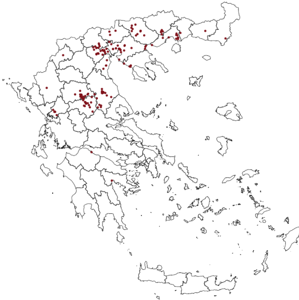
Εικόνα 2: Γεωγραφική κατανομή κρουσμάτων λοίμωξης από τον ιό του Δυτικού Νείλου, Ελλάδα, 2023 [1]

1. Δεν περιλαμβάνεται ένα περιστατικό για το οποίο δεν κατέστη δυνατός ο καθορισμός του ακριβούς πιθανού τόπου έκθεσης.